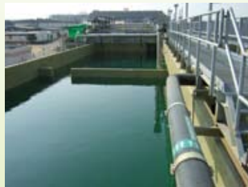
מתקן טיפול בשפכי תעשייה באינטל קרית גת המופעל בטכנולוגיית MBR (Membrane BioReactor)