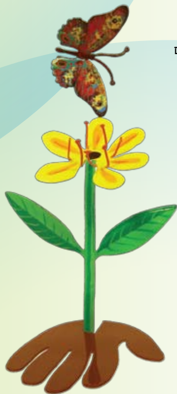
אות המצוינות הסביבתית עיצוב: דוד גרשטיין