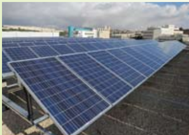
מערכת פוטו-וולטאית על גג מפעל אינטל בירושלים,

אינטל מחויבת לחדשנות ולאחריות סביבתית. היא עוסקת בפיתוח מתמיד של טכנולוגיות חדשות ומתמודדת עם סוגיות גלובליות מורכבות של שמירה על איכות הסביבה. יעדי ביצוע סביבתיים משולבים בכל הפעילות העסקית - החל בשלבי התכנון והייצור של המוצרים, דרך שלבי הבנייה והתפעול של מתקני הייצור והפיתוח, ניהול המשאבים וכלה בטיפול בפסולת שנוצרת.