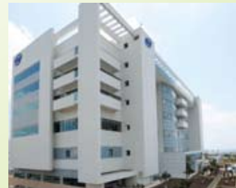
הבנין הירוק של אינטל בחיפה קיבל הסמכת LEED® בדרגת זהב ותו תקן ישראלי לבנייה ירוקה